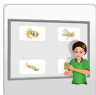
Werkstuk / spreekbeurt / muurkrant/ boekendoos